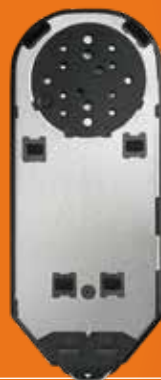
Cassette met 50 testen op een tape