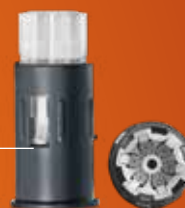
Lancethouder met 6 lancetten